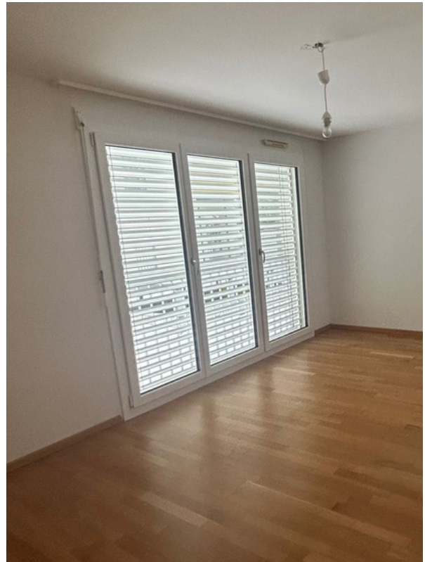
Chambre 2.5 pièces