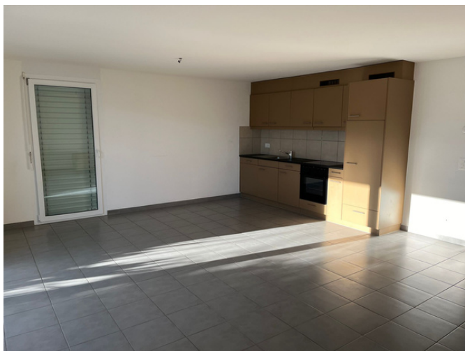
Cuisine (3.5 pièces)