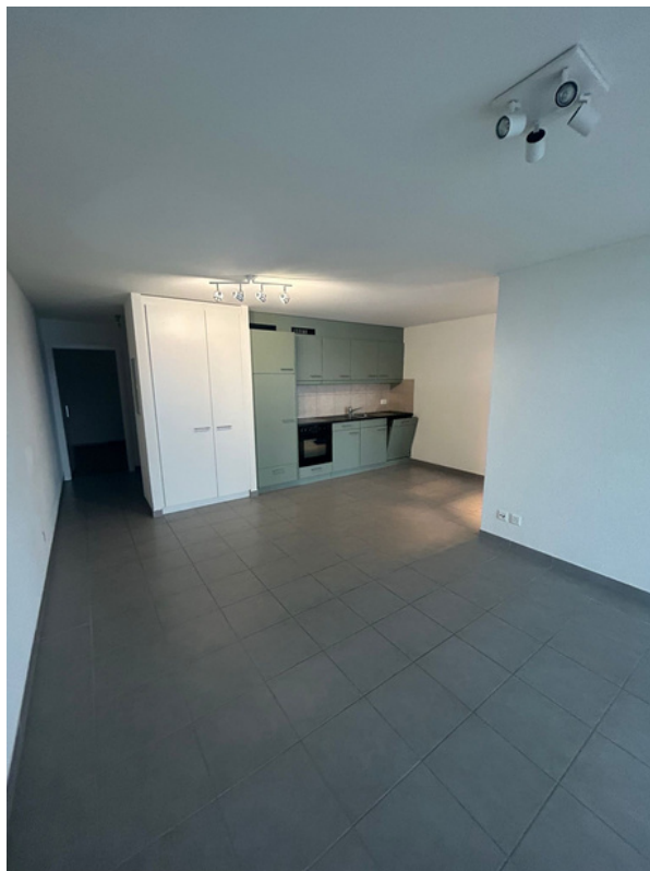
Cuisine et salon (2.5 pièces)