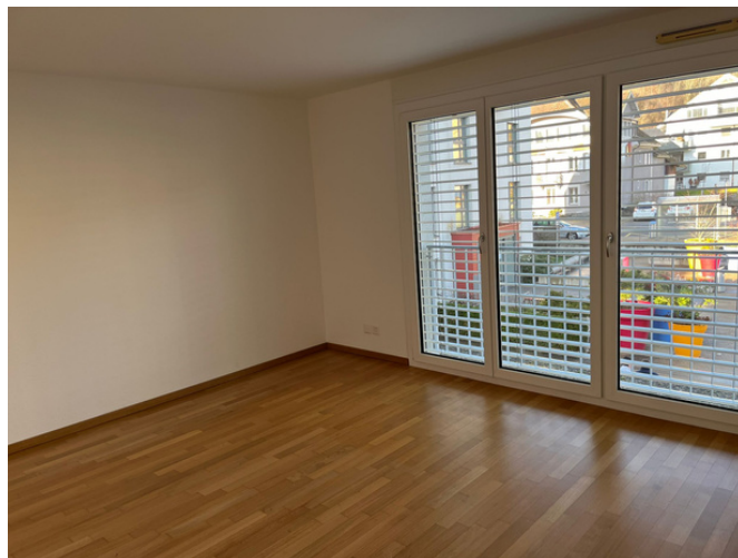
Chambre 3.5 pièces