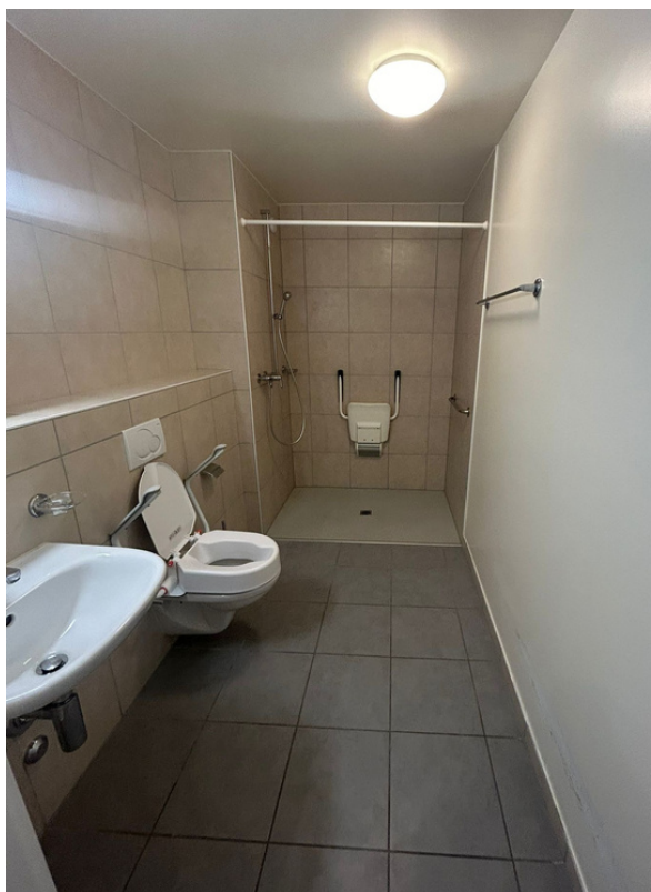
Salle de bain 3.5 pièces