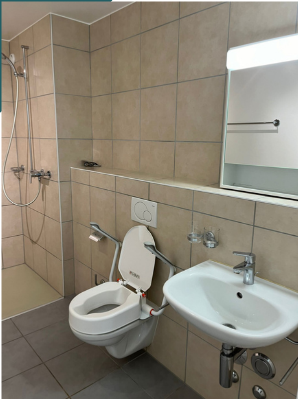
Salle de bain 2.5 pièces